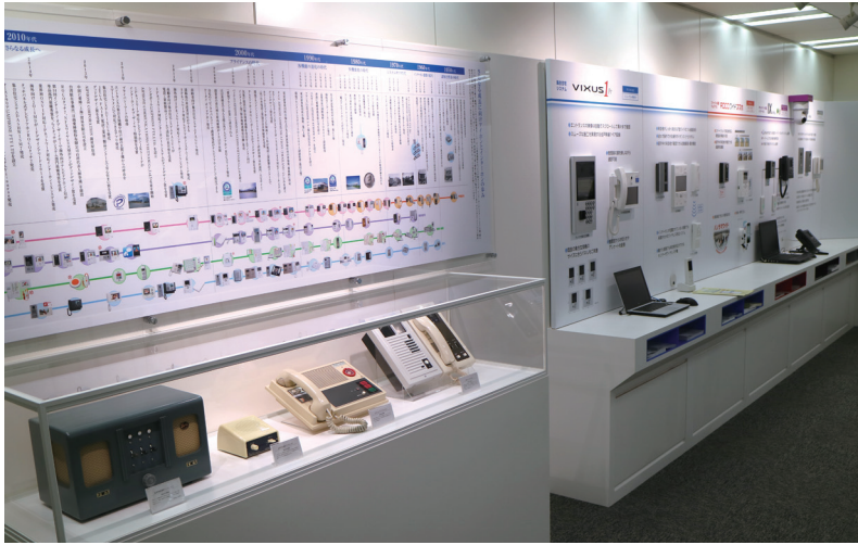
本社内のショールーム