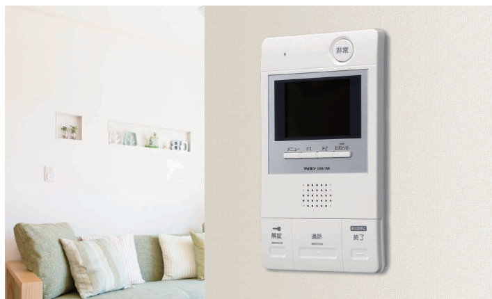
PATMO (居室親機 GBM-2MK)